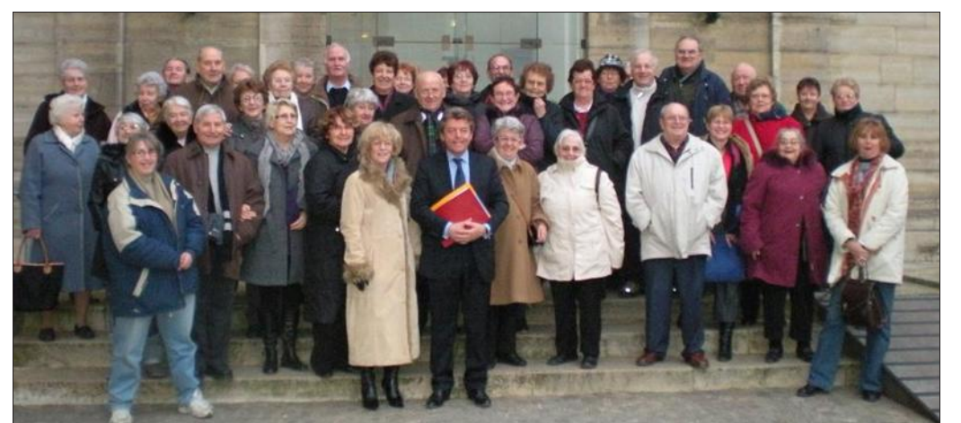
■ Une journée pour voir Paris et l'Assemblée nationale

Le CCAS de Gray a organisé une journée découverte de Paris et de l'Assemblée nationale. Cette sortie a réuni 50 participants accompagnés par deux membres du