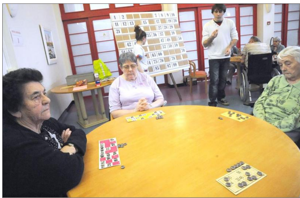
■ A l'Ehpad, le programme des animations suit les envies des résidents.

Pour les salariés (42 équivalents temps plein) et les 68 résidents. Le palmarès du Figaro prenant en compte « le confort de vie et la qualité des soins ».